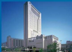
リーガロイヤルホテル小倉