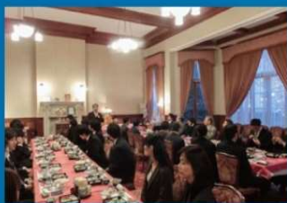
旧三井倶楽部 (国重要文化財)