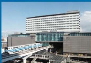
JR九州ステーションホテル小倉