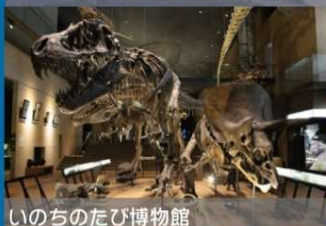
いのちのたび博物館