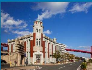
旧古河鉱業若松ビル