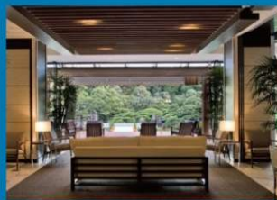
アートホテル小倉ニュータガワ