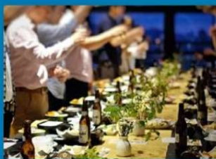
小倉城天守閣でレセプション (時間外特別貸切)