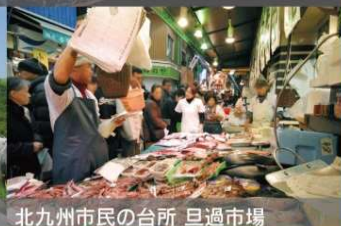
北九州市民の台所 巨過市場