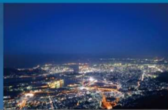
皿倉山山頂からの夜景