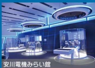
安川電機みらい館