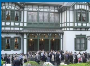
西日本工業倶楽部 (国重要文化財)

※Unique Venue（ユニークベニュー）とは… 歴史的建造物、文化施設や公的空間等で、会議・レセプションを開催することで特別感や地域特性を演出できる会場のことです。