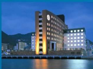
プレミアホテル門司港