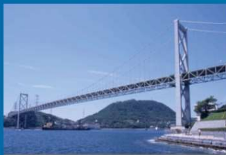
関門・門司港レトロ地区