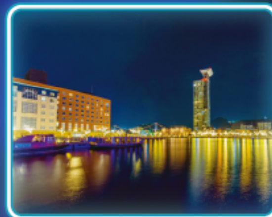
門司港レトロ地区