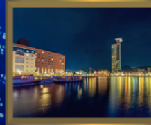
門司港レトロ地区