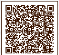
オンラインチケット

※全席指定席 ※未就学児入場不可(託児有/要予約) ※25歳以下チケットは1996年以降生まれの方が対象(入場時要証明) ※ご来場の際は、感染拡大防止対策にご協力お願いいたします。 ※内容が変更になる場合がございますので、最新情報は上記ホームページ をご覧くださいませよう願いたします。